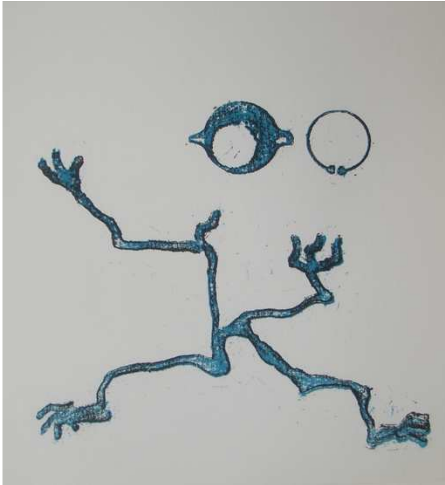
Max Ernst (1891-1976) - Lustige Logik II - Lithographie auf Bütten -1970 - aus Lewis Carols Wunderhorn- Hrsg. von Manus Presse Stgt - mit Passepartout - Blatt: 33 x 24,5 cm Motiv 20 x 20 cm - PP 50 x 40 cm / 26,5 x 24 cm